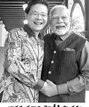
భారత (పధాని మోడీకి స్వాగతం పలుకుతున్న సింగపూర్ (పధాని లారెన్స్ వాంగ్

మేరకు సింగపూర్లో పర్యటించే (పధాని మోడీ పలు కార్యక్రమాలలో పాల్గొంటారు. సింగపూర్లలోని మూడు తరాల నాయకత్వ (శేణులతో ముచ్చటిస్తారని భారత అ ధికార వర్గాలు తెలిపాయి. సింగపూర్కు మోడీ వెళ్లడం ఇది ఐదోసారి. భారతదేశంలో సంస్కరణలు, ప్రత్యేకిం చి యువశక్తి ప్రతిభాపాటవాలు , అపార మానవ వన రులు వంటివి భారత్ను సర్వదా పెట్టుబడుల కేంద్రం చేస్తున్నాయని మోడీ తెలియచేసుకున్నారు. బ్రూనేలో త మ అధికారిక పర్యటనను ముగించుకుని, అక్కడి నుం దని ఆశాభావం వ్యక్తం అయింది.